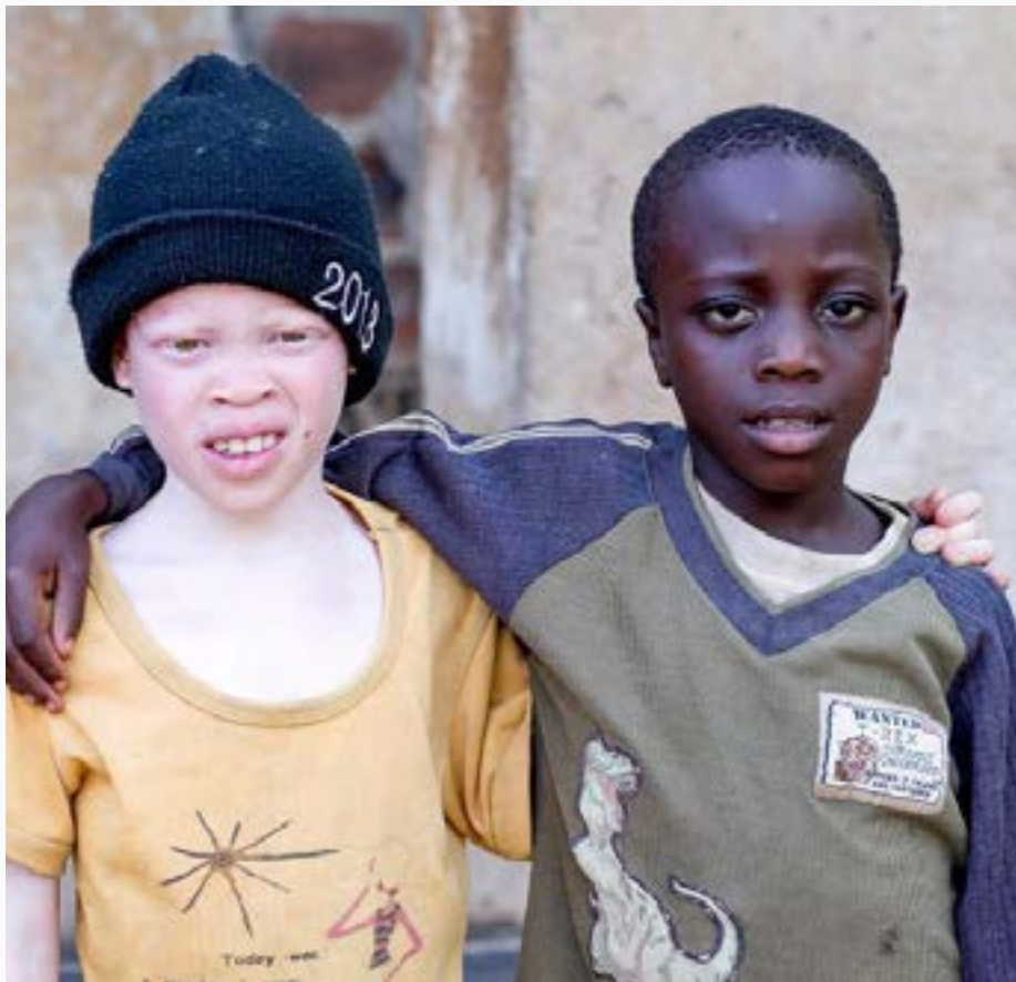
Barn som får hjelp ved vårt krisesenter i Uganda.