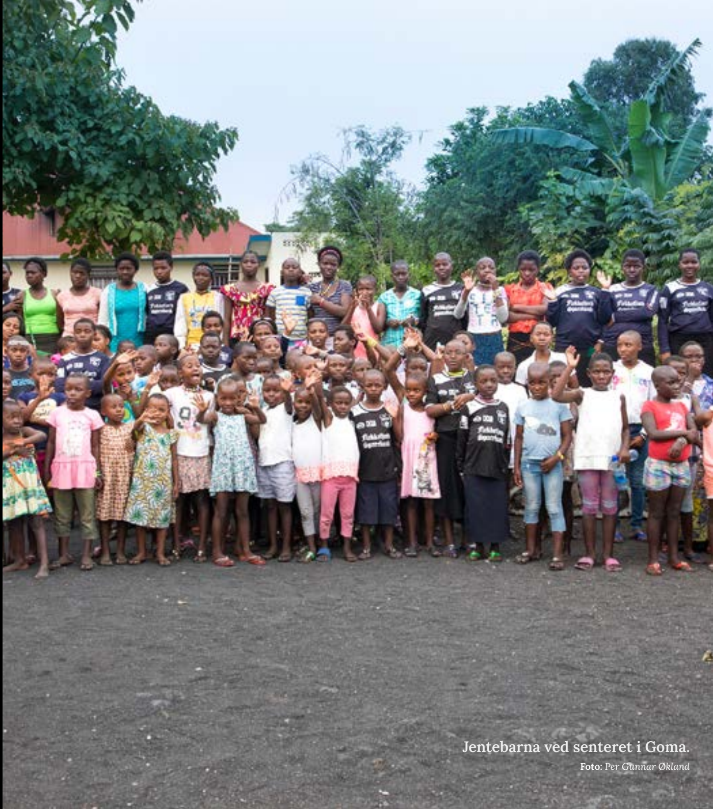
Jentebarna ved senteret i Goma.

Stiftelsen har også etablert hjelpeprosjekter i land som Uganda, Tanzania, Nepal, Irak og India, og har tidligere gitt bistand til Burundi, Indonesia, Kambodsja, og Myanmar.