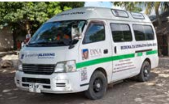
Den mobile klinikken

Det er en menneskerett å ha tilgang til helsetjenester, men det er fremdeles altfor mange som ikke har det. Dina-stiftelsens mobile klinikk gir de fattigste på Zanzibar tilgang på grunnleggende og livsviktig helsesjekker.