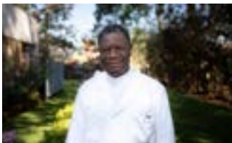
Dr. Denis Mukwege

I Bukavu var det ingen jenter med alvorlige sykdommer. Ei jente ble behandlet for tannmerter, ei for en skade hun pådro seg etter et fall, to ble undersøkt for manglende menstruasjonsblødninger, ei for høy feber, og ei jente for en skade i håndleddet. Disse jentene fikk behandling ved Panzi-sykehus, som er grunnlagt av den verdenskjente gynekologen, Dr. Denis Mukwege.